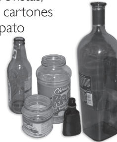
Contenedores de Vidrio para Bebidas y Alimentos (recicle las tapas por separado)