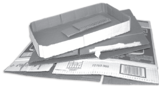
Cartón (aplastese cajas)

COLOQUE LOS ARTÍCULOS SIGUIENTES TODOS JUNTOS en la Carreta Azul de Reciclaje o el Cajón Blanco de Reciclaje: