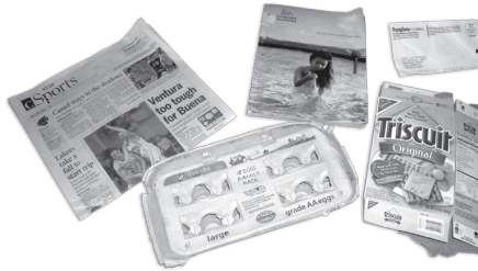
Papel Limpio y de Buzón: papel blanco y colorado de buzón, periódicos, revistas, catálogos, bolsas de papel, sobres, cartones de huevo, cereal, galleta o zapato