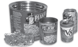
Metal o Botes de Aluminio (etiquetas y tapas estan bien)